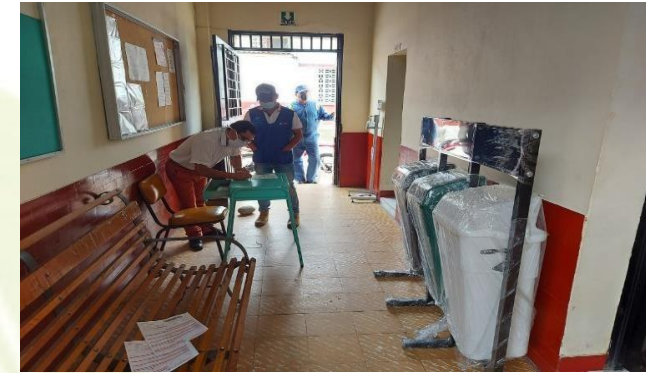
PUNTOS ECOLOGICOS ENTREGADOS