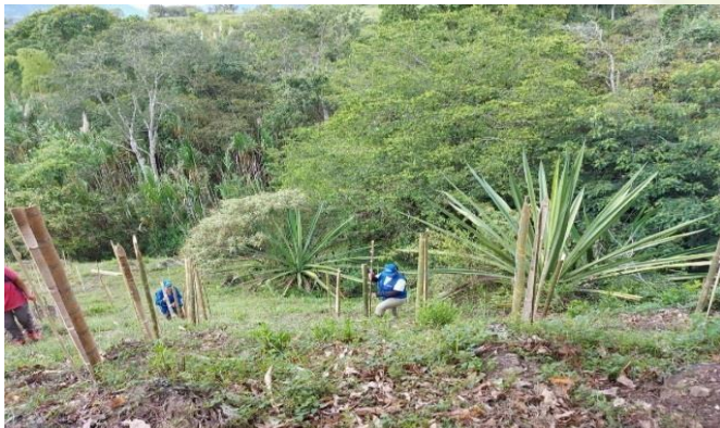
1,5 HECTAREAS REFORESTADAS 500 árboles