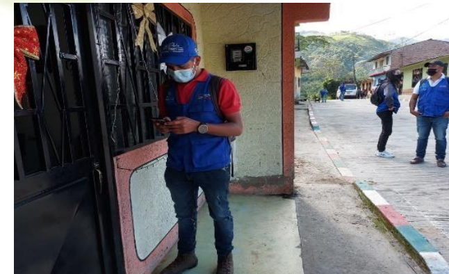
10.621 VISITAS PUERTA A PUERTA