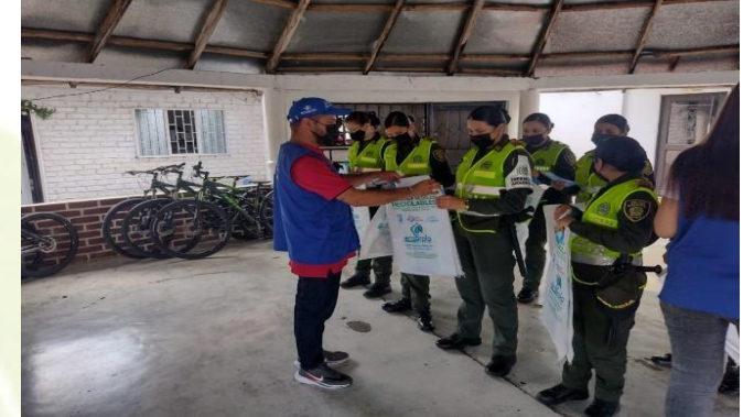
CAPACITACIONES DE EDUCACION AMBIENTAL (comunidad Urbana-Instituciones- Centros Poblados - 1,380 capacitados con kit de separación en la fuente)