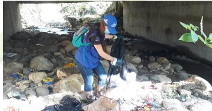
LIMPIEZA FUENTES HÍDRICAS Recolección de 10.975 kl residuos inservibles.