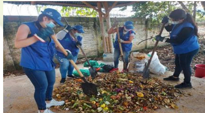
REACTIVACION DE COMPOSTERAS