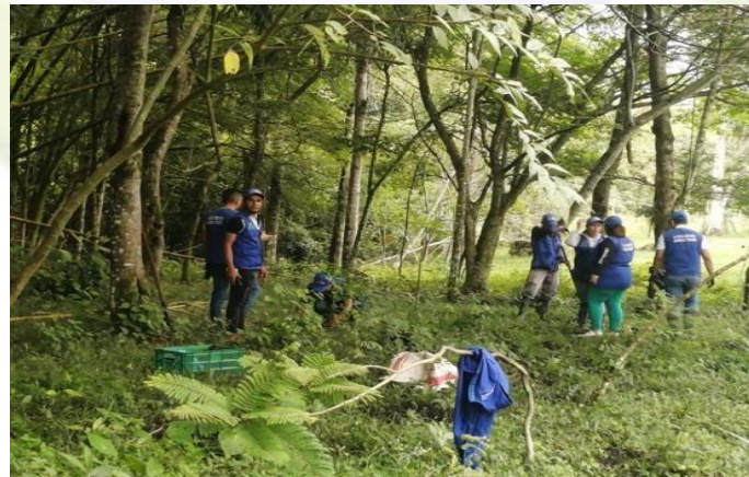
REFORESTACION - (plantación 500 árboles)