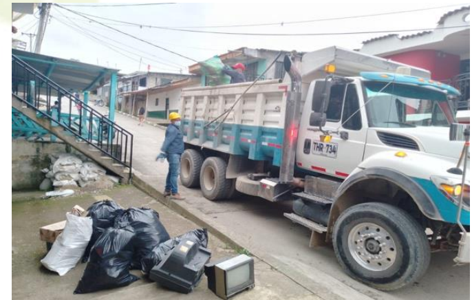
APOYO A RECOLECCION RESIDUOS EN CENTRO POBLADOS