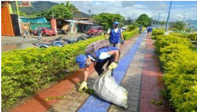
EMBELLECIMIENTO PAISAJISTICO Recolección de material Verde (1.056 KL)